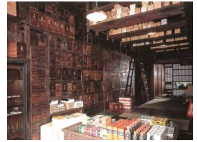
Edo-Tokyo Open Air Architectural Museum (Wednesdays, Thursdays, and Fridays only)